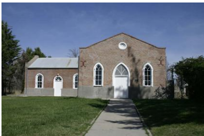
Capel Moriah, 2005

Pryd adeiladwyd Capel Moriah a phwy oedd gweinidog y capel?