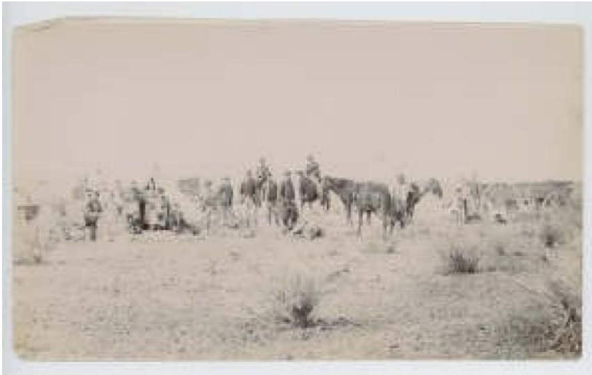
Teuluoedd ar eu ffordd i Gwm Hyfryd, Chubut, dechrau'r 1890au