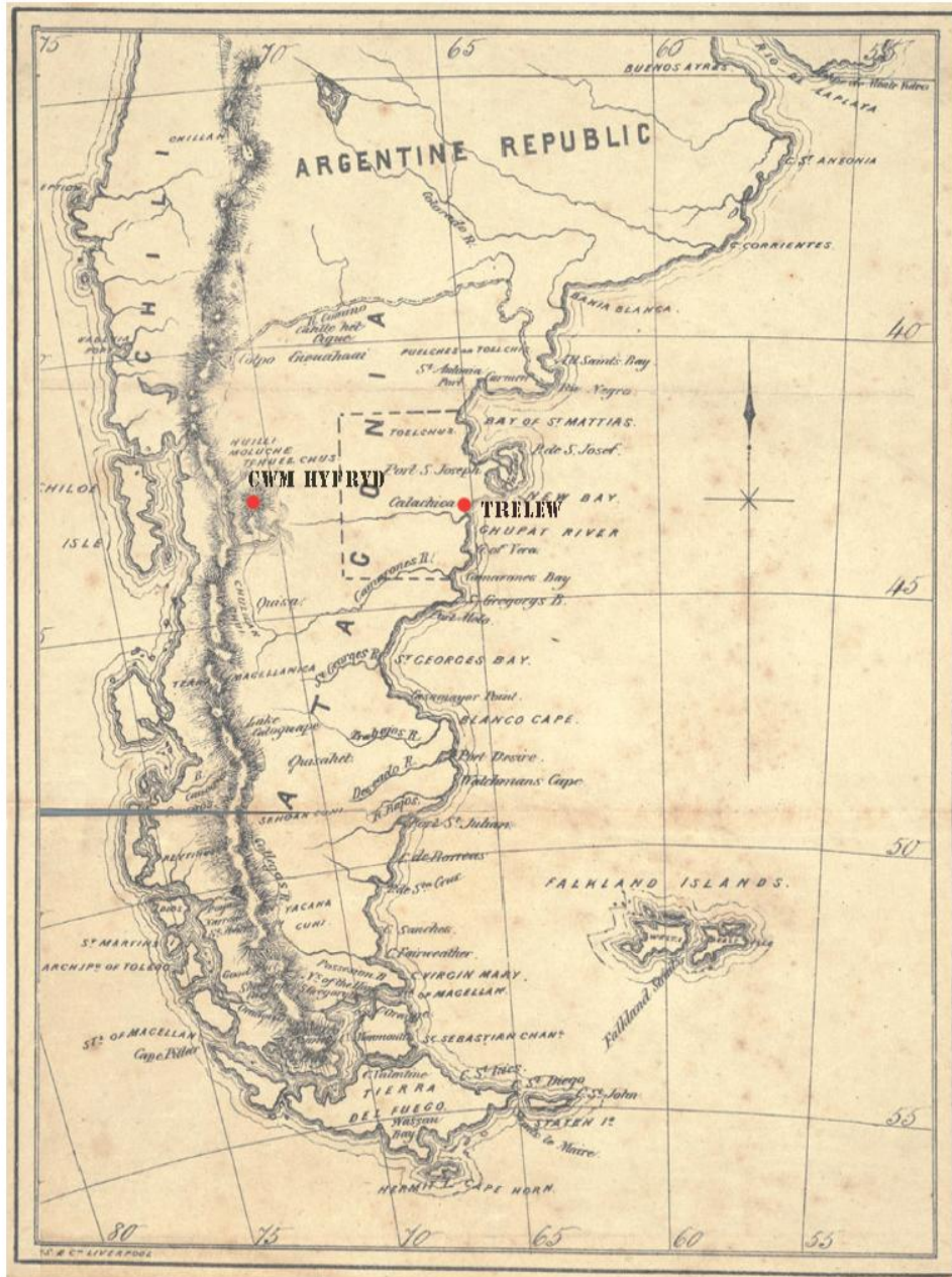
Map o Batagonia o 'Llawlyfr y Wladychfa Gymreig' (1862)

Amcangyfrifwch y pellter - gallwch ddefnyddio mapiau modern i'ch cynorthwyo