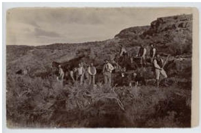
Adeiladu'r ffordd i'r Andes, ger Hafn y Mynach, 1888

Ym 1886, teithiodd Llwyd ap Iwan, mab Michael D. Jones, i'r Wladfa. Fel trefesyrydd, roedd ganddo ddiddordeb arbennig yn y tirlun anghyfarwydd, yn ogystal â gwybodaeth arbenigol a fyddai o gymorth wrth fesur a mapio tiroedd newydd. Rhwng 1888 a 1897, mentrodd ar gyfres o deithiau dros y paith ac i fynyddoedd yr Andes. Cadwodd ddyddiaduron manwl, ac yn ogystal â bod yn gofnod o'i deithiau, maent yn cynnwys manylion diddorol am y dirwedd a'r bywyd gwyllt.