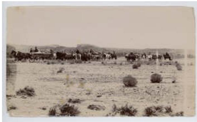
Dechrau ar daith archwiliadol i'r Andes, Llyn Fontana, Chubut, 1892