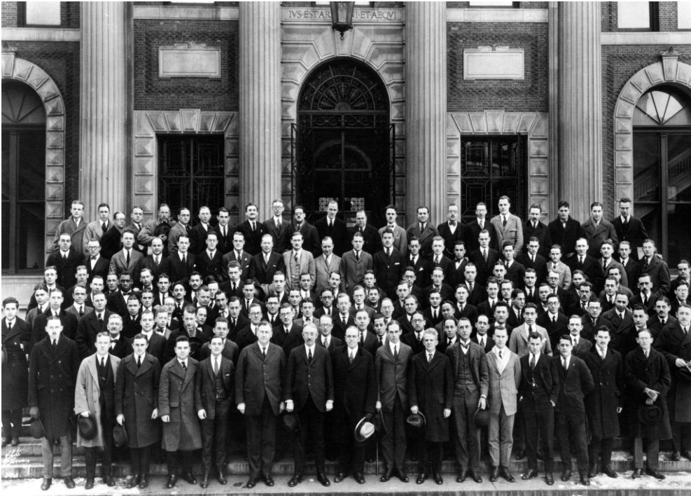
Ysgol Y Gyfraith Columbia, 1923

Beth mae cydraddoldeb yn ei olygu i chi?