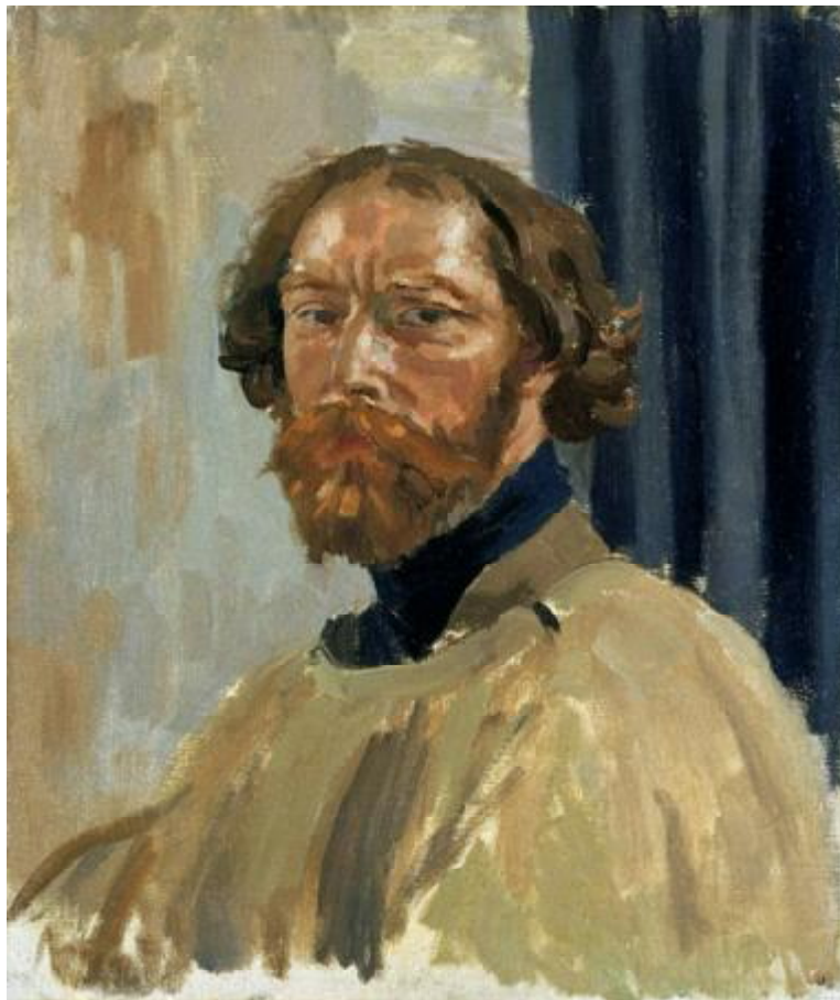
Hunanbortread Augustus John (1878-1961)